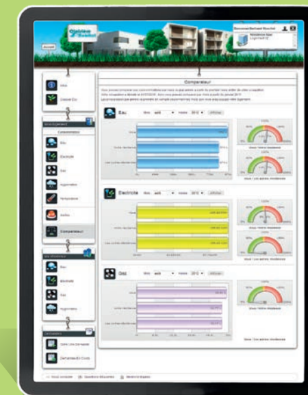
Un comparateur anonyme pour évaluer ses consommations par rapport aux autres locataires de la résidence et de l'ensemble du parc géré par votre bailleur