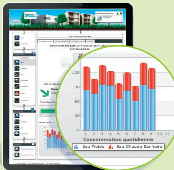
Une vision détaillée des consommations du logement pour chaque fluide