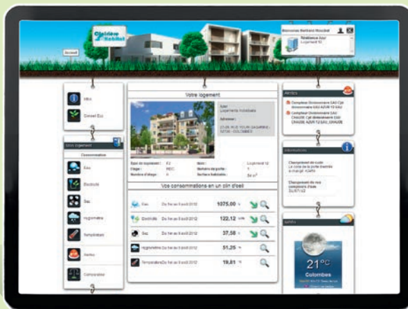
Une vision synthétique du logement : consommations, alertes, informations de la résidence